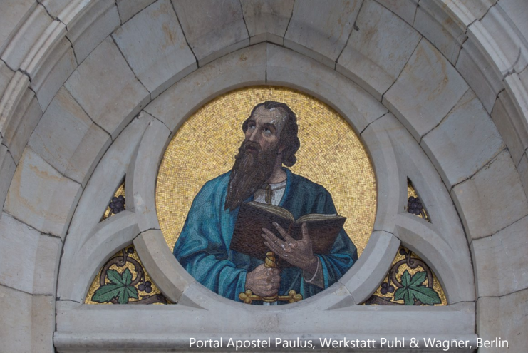
Portal Apostel Paulus, Werkstatt Puhl & Wagner, Berlin